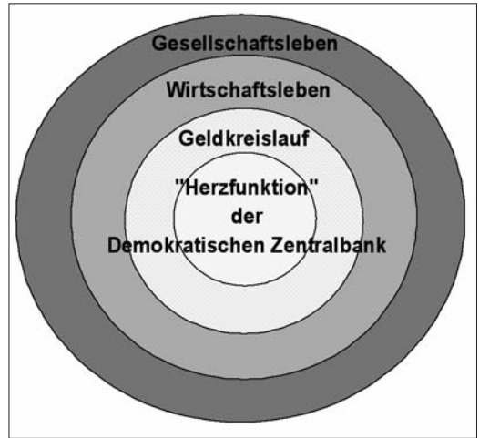
Abb. 3: Die "Herzfunktion" der Demokratischen Zentralbank

tion” inne. Sie ist pulsierender Mittelpunkt des Geldkreislaufs, sein Ursprung und sein Endpunkt. Weil die Zentralbank im Zentrum des gesamten wirtschaftlichen und gesellschaftlichen Lebens steht, muss sie demokratisch kontrolliert werden.